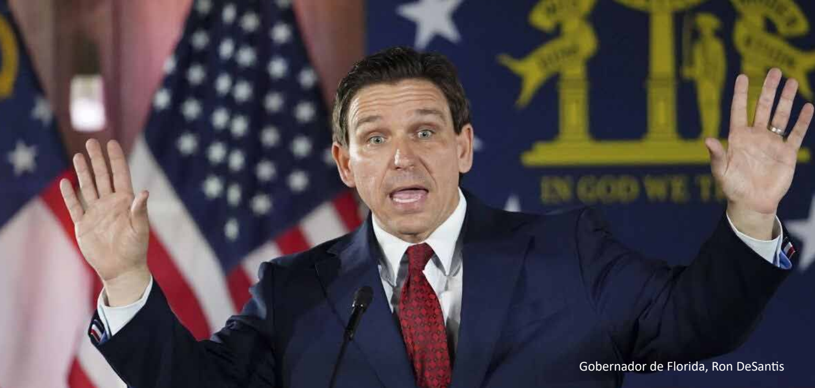
Gobernador de Florida, Ron DeSantis

Otro de los objetivos es que otros estados, afines a las políticas de DeSantis, tomen una postura similar y establezcan estas prohibiciones dentro de sus respectivos códigos comerciales, para “luchar contra este concepto en todo el país”.